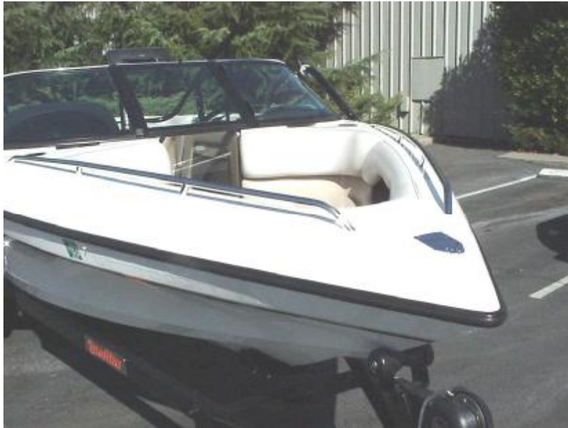
شکل ۱- نمایی از یک قایق موتوری از جنس فایبرگلاس

محصولی که در این طرح مورد بررسی قرار گرفته است، قایق فایبرگلاس ۱۰۵ کیلوگرمی با مشخصات