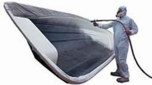
شکل ۲- کاربرد محصولات کامپوزیتی در صنایع دریایی [۱]