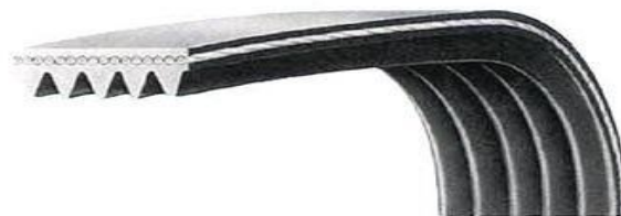
شکل ۲- شمایی از تسمه‌های شیاری