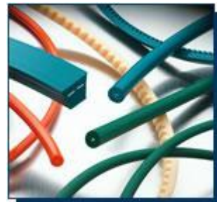
شکل ۳- شمایی از تسمه‌های پلاستیکی