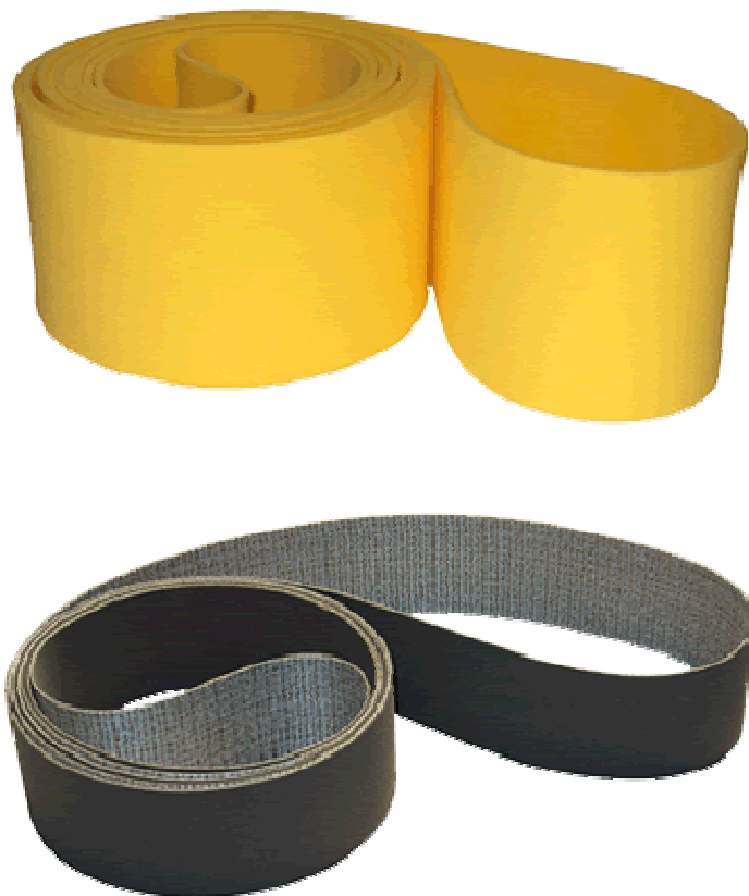
شکل ۴- شمایی از تسمه‌های انتقال نیرو

تسمه‌های انتقال نیرو، تسمه‌های تخت ( Flat ) هستند که عمدتاً از سه لایه تشکیل می‌شوند. دو لایه خارجی از جنس رابر ( Rubber ) و یک لایه داخلی ساخته شده از ترکیباتی شیمیایی مانند پلی‌آمید ساخته شده‌اند. این گونه تسمه‌ها دارای تنوع زیادی می‌باشند [۱].