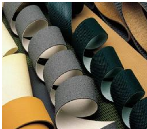
شکل ۷- شمایی از تسمه‌های غلطکی

- نوارهای ضد سایش: این گونه نوارها از مواد خاصی ساخته شده‌اند که در برابر سایش و اصطکاک مقاومت خاصی دارند. این نوارها را بر روی تسمه‌هایی که وظیفه کشش و انتقال کالاهای خشن و برنده را دارند نصب می‌شوند تا از افزایش و از بین رفتن زود رس تسمه جلوگیری به عمل آید. این نوارها دارای ضخامت‌های مختلفی می‌باشند ولی در شکل ظاهری تنوع چندانی ندارند [۱].