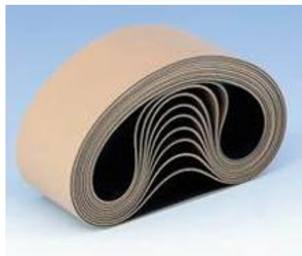
شکل ۵- شمایی از تسمه‌های آبرون