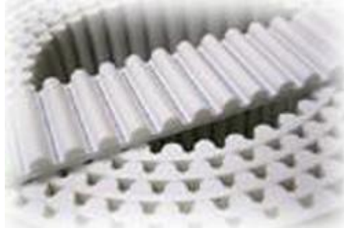
شکل ۱- شمایی از تسمه‌های تایمینگ